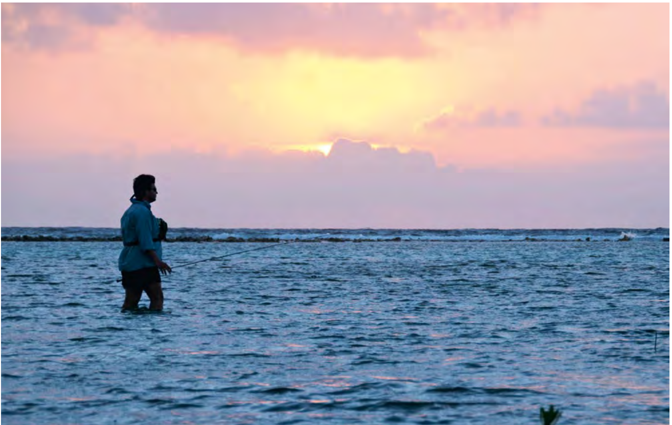
Brooks kirjoitti useita Bonefishin kalastusta käsitteleviä artikkeleita ja sivusi aihetta useissa kirjoissaan.

Hieman ennen kuolemaansa Brooks kirjoitti vielä kirjan Trout Fishing (1972). Sen rakenteesta ja visuaalisesta ilmeestä muodostui eräänlainen perhokirjojen standardi ja koulukirjaesimerkki, jota lukuisat kirjat ovat myöhemmin toistaneet. Siinä teemat olivat selkeästi jäsentyneet, asiat esitettiin ytimekkäästi, lyhyehköin luvuin ja kirkkain lausein. Sanomaa ryyditettiin runsain saaliskuvin – kirja oli myös perhokalastuksen mielikuvamarkkinointia. Asiatekstiä elävöittävät lyhyet, tarkkarajaiset anekdodit. ■